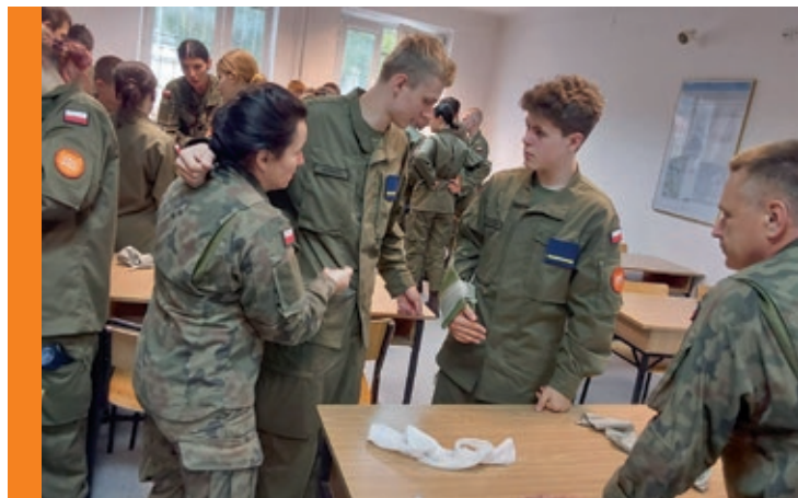
Nauka zakładania opatrunków.

Kielce • Jędrzejów • Końskie • Włoszczowa