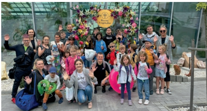
Uczestników i opiekunów zawodowych półkolonii nigdy nie opuszczały humory.

Odbyły się warsztaty cukiernicze, pokaz dżudo, fitness. Było spotkanie z mundurem, warsztaty fryzjerskie, zajęcia informatyczne z użyciem gogli VR, czyli okularów wirtualnej rzeczywistości.