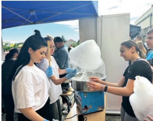
Uczennice z kierunku technik żywienia i usług gastronomicznych, podczas festynu szkolnego „Rejs z dziewiątką”.