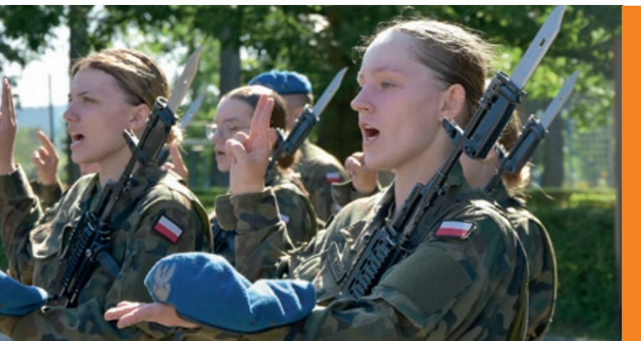
Uroczysta chwila składania przysięgi.