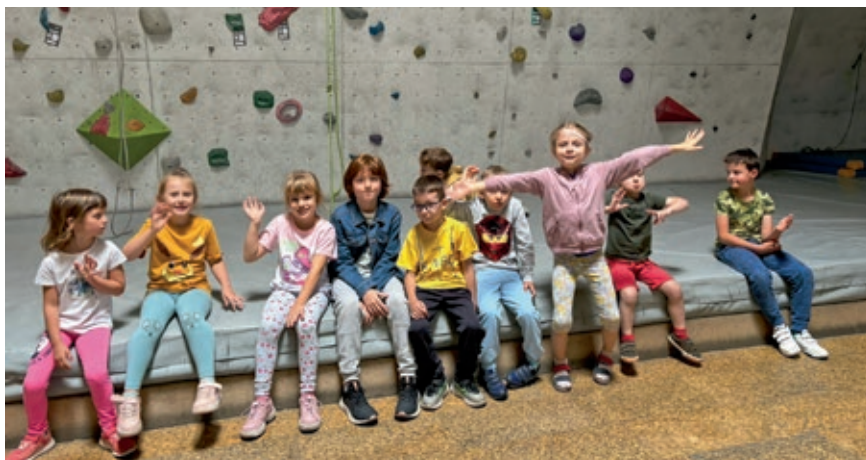
Półkolonie w Kielcach. Ścianka wspinaczkowa jak widać nie stresuje.

w Kielcach. Następna kadencja pięcioletnia, to inwestycyjne pomysły i realizacje, bo moja teoria brzmi, że zawsze, choćby niewielkimi krokami, ale należy rozwijać Zakład. I to się dzieje. Powstają nowe kierunki, kursy, dostosowane do wymagań rynków lokalnych. Realizowane są inwestycje. Dyrektorzy i nauczyciele zatrudnieni w jednostkach Zakładu Doskonalenia Zawodowego w Kielcach, doskonale wiedzą, które propozycje nowych aktywności Zakładu Doskonalenia Zawodowego spotkają się z zainteresowaniem.