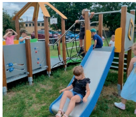
Nowy, powiększony plac zabaw przy przedszkolu w Chmielniku, zrealizowany w ramach Europejskiego Funduszu Społecznego Plus.

Jednostki terenowe mają za zadanie przeprowadzenie rekrutacji do tych programów.