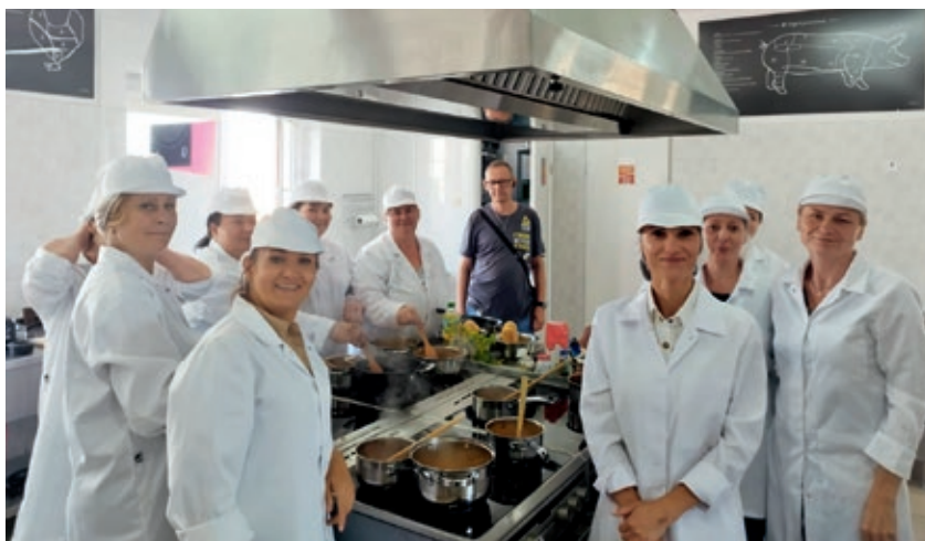
Zadowolone z przebiegu szkolenia kursantki, chętnie pozowały do zdjęcia.

W Zakładzie Doskonalenia Zawodowego w Kazimierzy Wielkiej, obok Technikum prowadzona jest działalność kursowa.