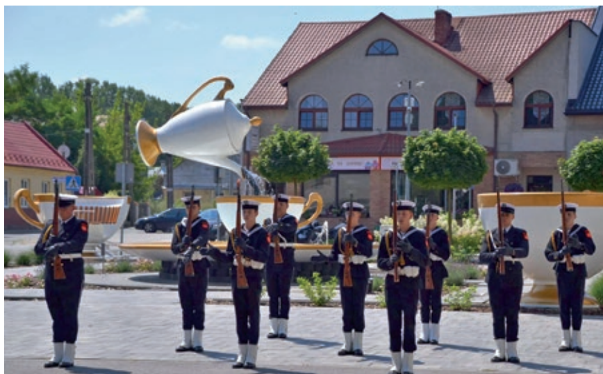
Kompania reprezentacyjna na Porcelanowym Rynku w Ćmielowie.