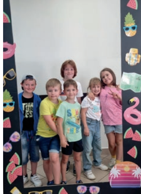
Pamiątkowe zdjęcie z półkolonii.

- Nie jesteśmy zawsze w sali. Mamy niespodzianki: basen, ścianka wspinaczkowa, wycieczka do Skarżyska, do zagrody ze zwierzątkami. Półkolonie trwają tydzień. Dzieci się nie nudzą, rodzice są zadowoleni, to dla nas największa nagroda.