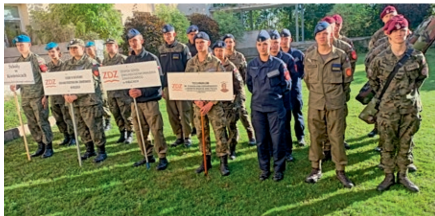
Uczestnicy trzeciego etapu zawodów tuż przed startem.