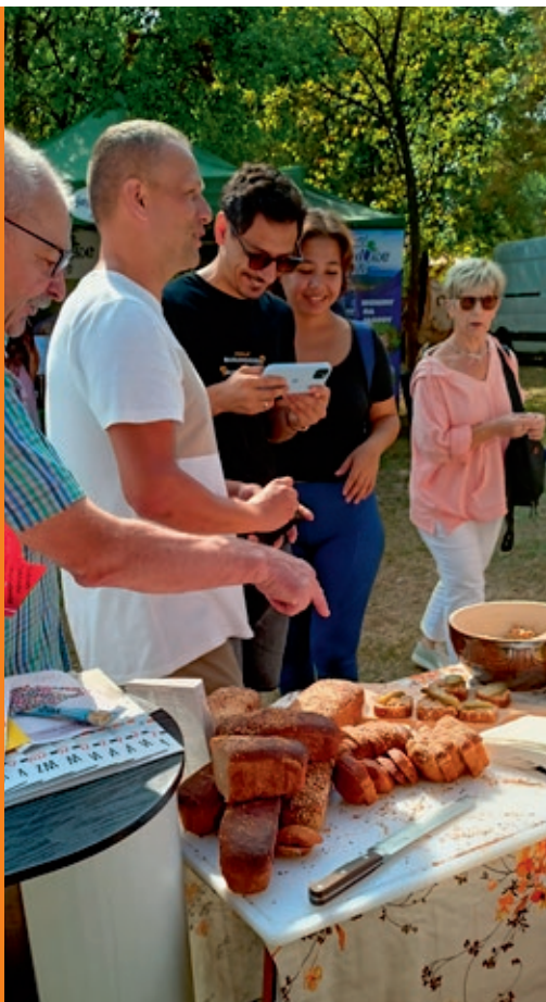
Tradycyjnie wypiekane chlebki zachwycały.

– Miło było patrzeć, jak zaraz po tym, gdy moje dziewczyny weszły na scenę, zaroilo się od tańczących par – podsumowała udany, długo oklaskiwany występ uczennic ZDZ, dyrektorka Misztal.