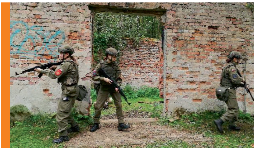
Dziewczyny poznają podstawy szkolenia bojowego.

- Chcę studiować w Wojskowej Akademii Technicznej, więc innowacja wojskowa, szkolenia takie jak to, pozwala mi zdobywać nową wiedzę i utwierdzać się w przekonaniu o słuszności mojego wyboru. Czego nowego się nauczyłam? Na przykład jak zachować się wobec zagro-