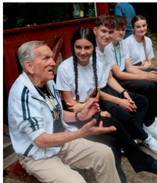
Niespieszne zwiedzanie muzeum było okazją do wielu rozmów z naszymi uczniami.

To nie pierwszy projekt dla seniorów, który realizuje Centrum Kształcenia Zawodowego w Radomiu we współpracy z Urzędem Miejskim.