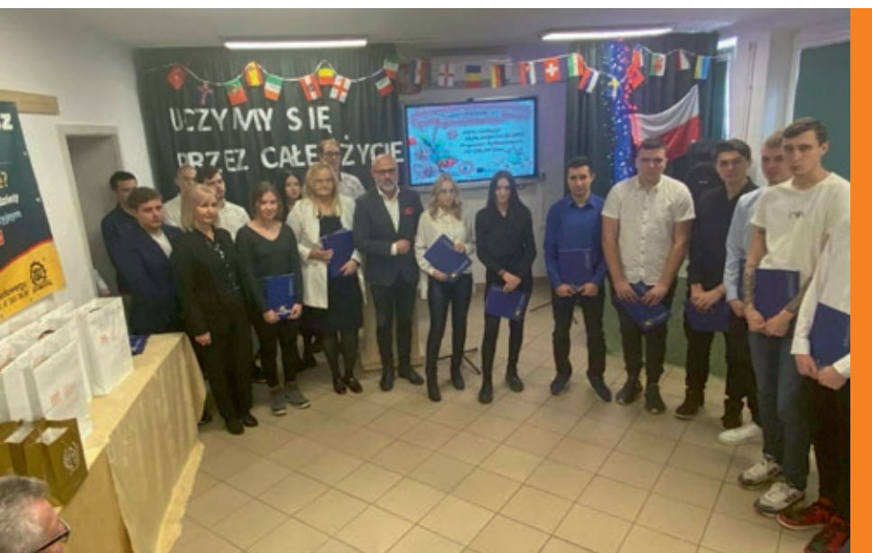
Praktyki zawodowe zakończone! Wyjazdy zostały zrealizowane w ramach Programu FERS 2021-2027, współfinansowanego z EFS+.