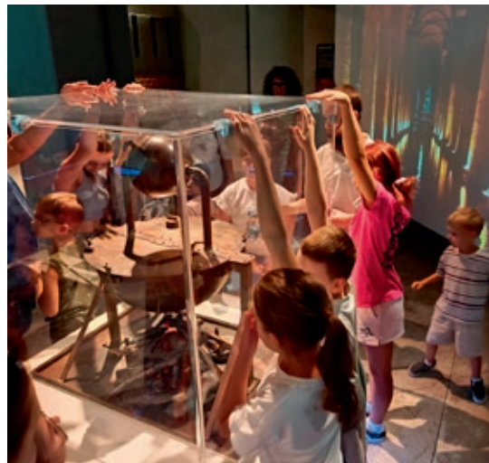
Zabawa poprzez naukę w Hydropolis.

Organizatorki podkreślają, że wycieczki służą integracji.