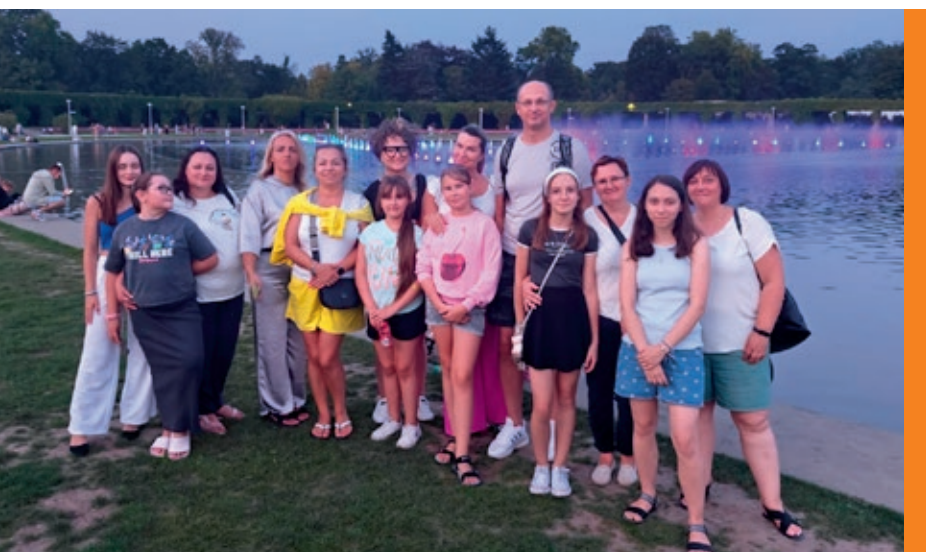
Grupa z Radomia przy tańczących fontannach.

– Miło słyszeć, gdy dzieci pytają kiedy wreszcie będzie ta wycieczka z ZDZ, a potem umawiają się już między sobą na kolejne spotkania, choćby przy okazji organizowanych przez nas w grudniu każdego roku Mikołajek – dodaje.