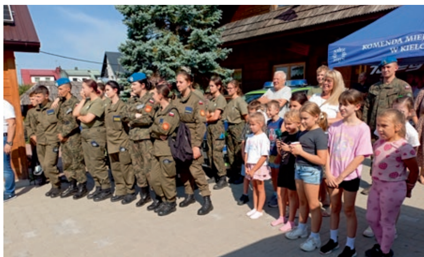
Musztra podobała się dorosłym i dzieciom.