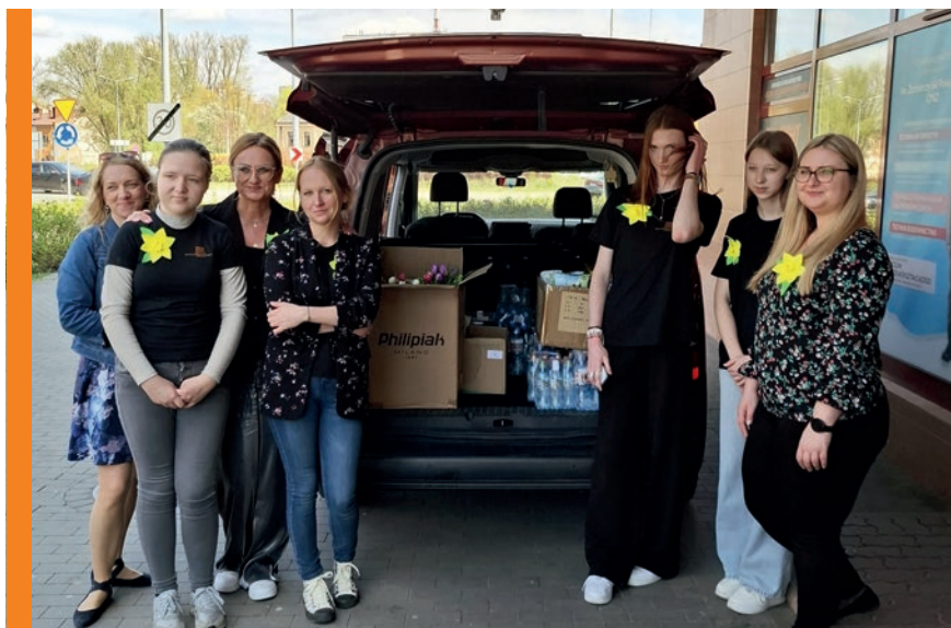
Dobra robota. Dary dla hospicjum spakowane.