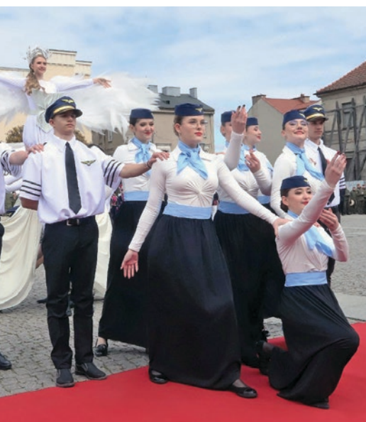
Radom. Występ podczas ślubowania.

Po podniesieniu flagi państwowej i odśpiewaniu hymnu narodowego, przy dźwiękach Orkiestry Reprezentacyjnej WOT, w otoczeniu rodzin i przyjaciół, ponad 150. uczniów klas pierwszych, w tym klas mundurowych Oddziału Przygotowania Wojskowego, Branżowych Oddziałów Wojskowych oraz uczniów realizujących zajęcia z edukacji policyjnej, złożyło uroczyste ślubowanie.