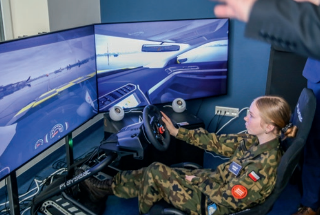
W takich warunkach, nauka to sama przyjemność.