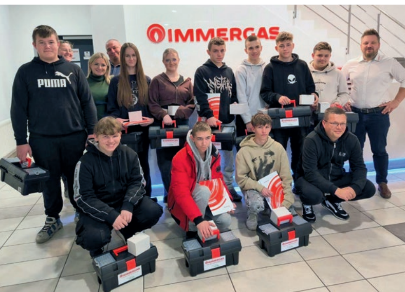
Uczniowie klasy o profilu technik urządzeń i systemów energetyki odnawialnej na zaproszenie firmy Immergas Polska w centrum szkoleniowym w Łodzi.