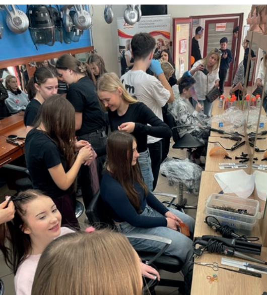
Wesoło w pracowni fryzjerskiej.