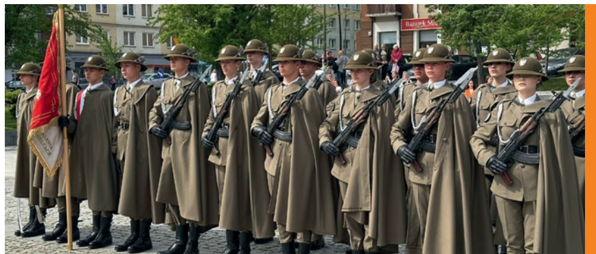
Ślubowanie w Ostrowcu Świętokrzyskim.