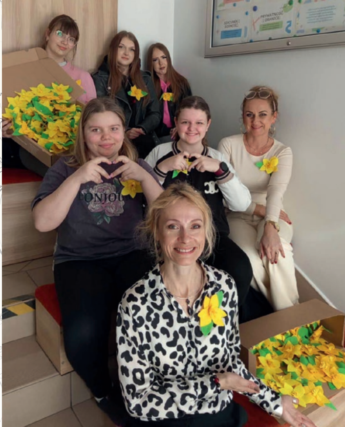
Żółte żonkile już gotowe.