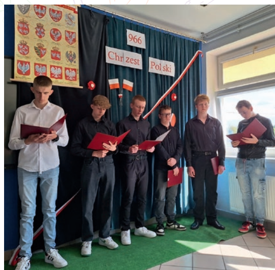
Żywa lekcja historii.