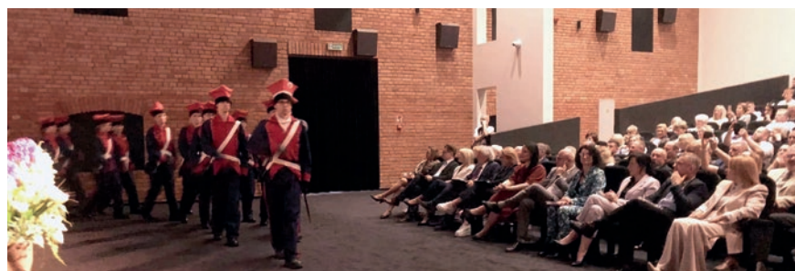
Podczas konferencji zaprezentowała się drużyna historyczna.