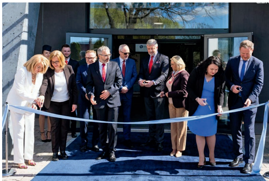
Branżowe Centrum Umiejętności Służb Lotniskowych otwarte.