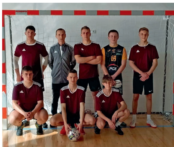
We Włoszczowie liczy się sport.