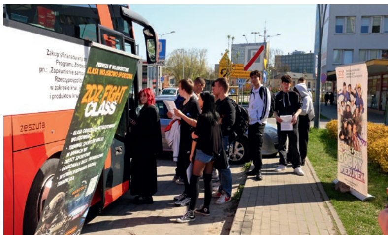
Pełnoletni, młodzi Honorowi Dawcy Krwi.

Szkolne Koło Wolontariatu Szkół ZDZ w Kielcach wielokrotnie w ciągu roku organizuje akcje charytatywne.