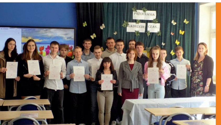
Uczniowie Branżowej Szkoły II Stopnia, uroczystie zakończyli naukę.

Suliga i dodaje - Jesteśmy zawsze, gdy coś się dzieje i tam, gdzie jesteśmy potrzebni. A na co dzień wspieramy naszych uczniów i z dumą patrzymy na ich osiągnięcia. Od sportowych, przez recytatorskie, artystyczne, aż po udział w turniejach i olimpiadach.